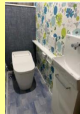
S様邸 水廻り改修工事