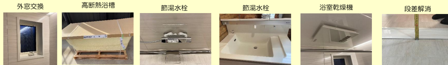
〇様邸 浴室&洗面改修工事