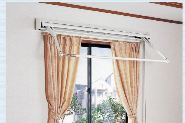
窓際を物干しスペースに活用。 竿は操作ひもを引くだけで簡単に出し入れできます。

※備わる性能や機能は商品シリーズによって異なります。詳しくは各商品情報をご確認ください。 ※掲載内容は、2024年1月現在のものです。