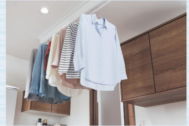
天井下の空きスペースを活用して干せるので じゃまにならず、お部屋もスッキリ。