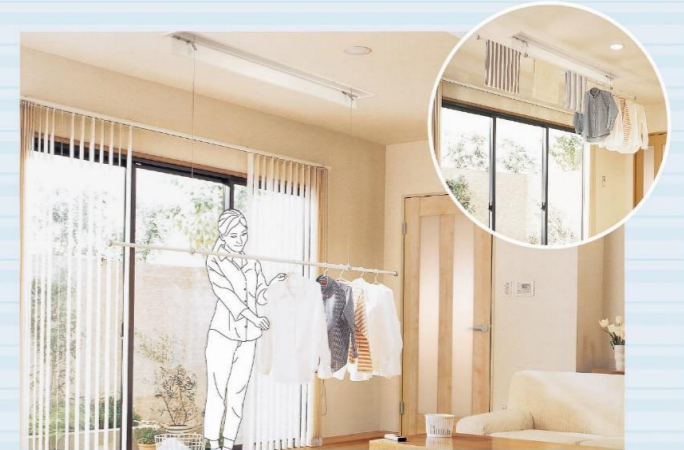
竿を手元まで降ろして、ラクな姿勢で作業できます。 干した後は天井近くまで上げて、お部屋もスッキリ。